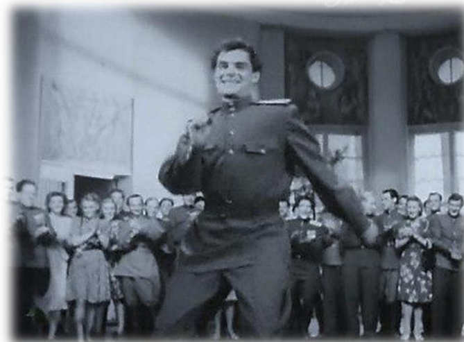
Кадры из фильма