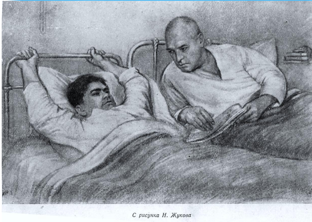
С рисунка Н. Жукова

Спустя 18 дней он, лишенный пищи, мучимый жаждой, с отмороженными ногами, к счастью, попал к партизанам.